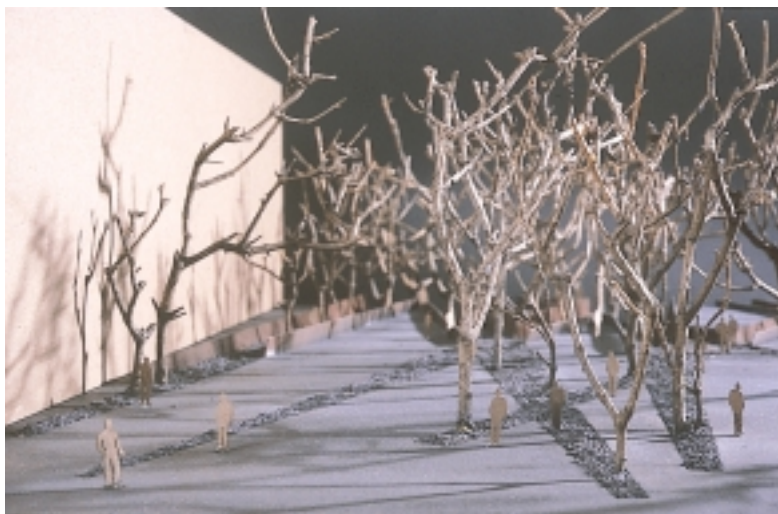
הכניסה לאנדרטה מכוון הכיכר