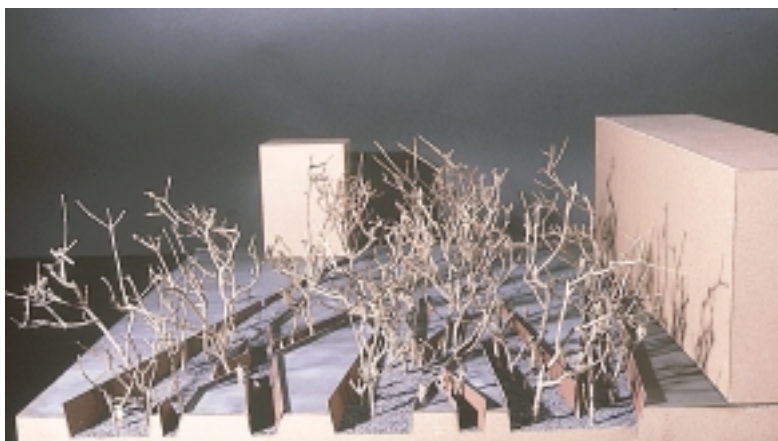
חתך באיזור העליון של האנדרטה

קולקטיבית, כאשר החללים הולכים ומתרחבים וכאשר הם מצטלבים. מקומות התקבוצות, רגעים של עזירה בתוך התנועה של האנדרטה, מאפשרים שיח ומפגש.