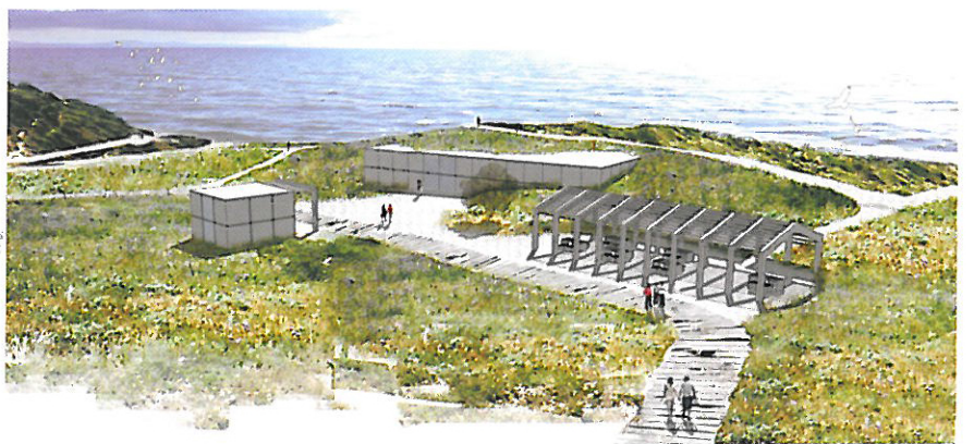
▲ מרכז טבעירוי - מבסיס נטוש למוקד חינוך ומידע כלל עירוני