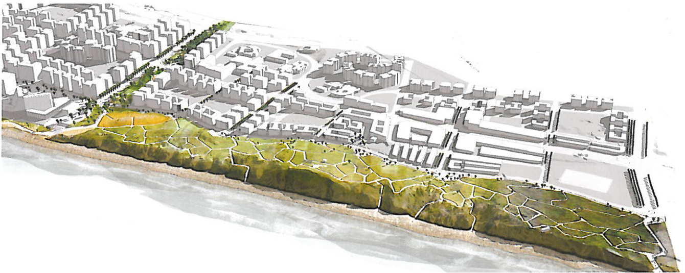
▲ מבט על ממערב